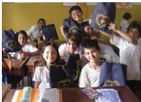
Escuela Santa Teresita del Niño Jesús San Lorenzo