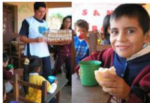
Escuela Básica N° 6881 "San Jorge"

El Programa Niño Futuro en el Presente apunta a brindar a niños y niñas de 7 a 9 años, una alternativa integral que complete su formación en valores, a partir de la recreación, el deporte y la danza. Así, la LBV realiza talleres con profesores voluntarios en el Jardín de Infantes y Preescolar José de Paiva Netto, los sábados de 9 a 11 hs.