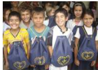
Escuela Cerro Poty Lambare

Las escuelas beneficiadas fueron seleccionadas a través de visitas de las trabajadoras sociales de la LBV, destinadas a conocer la situación de los alumnos y alumnas, quienes finalmente comprobaron la difícil situación que atraviesan los niños y niñas que asisten a dichos establecimientos.