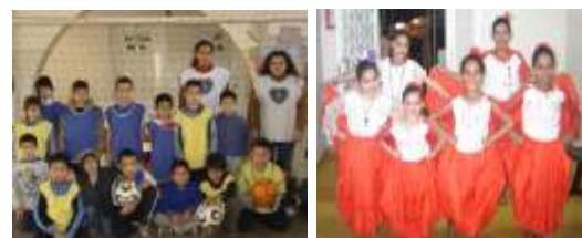
Fútbol y Danza para niños y niñas en Asunción