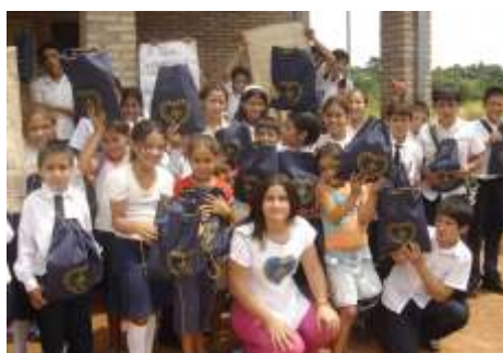
Escuela Madre Teresa de Calcuta Ciudad del Este