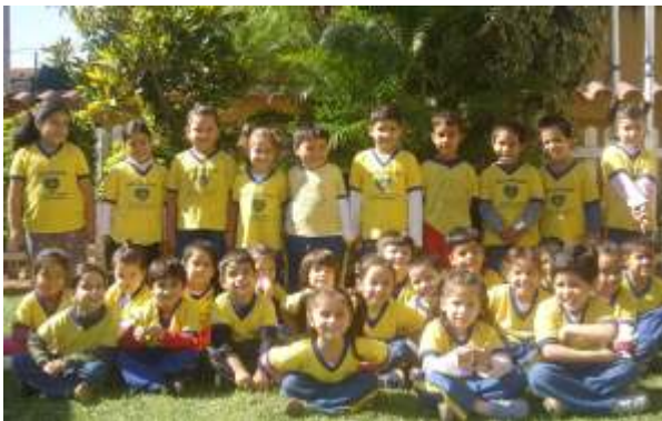
Alumnos y Alumnas del Jardín de Infantes y Preescolar José de Paiva Netto

Los resultados alcanzados nos muestra que trabajar por la transformación es una tarea constante, eso nos motiva a invitarlos a todos a seguir adelante, en la construcción de la Sociedad Solidaria "por un Mundo Mejor y Más Feliz."