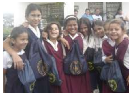
Escuela San Miguel Lambaré