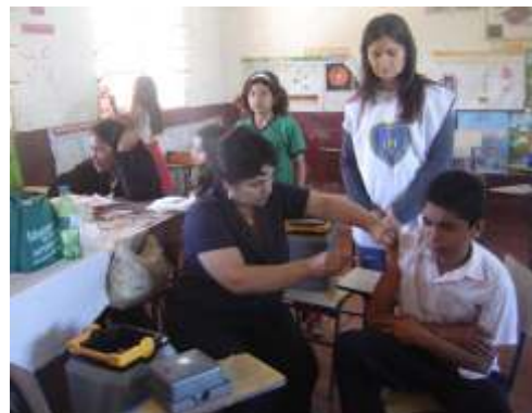
Escuela "Madre Teresa de Calcuta"